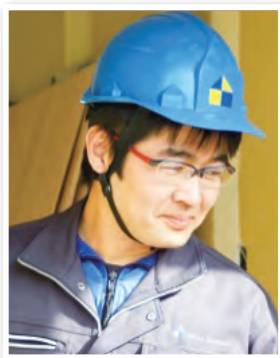
始良支店 工務課 係長代理